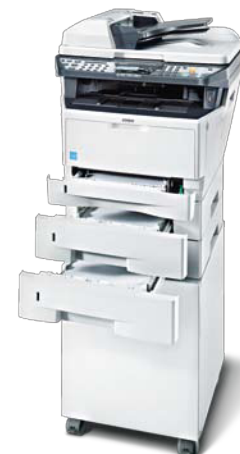
Produkten på bilden innehåller extra tillbehör.